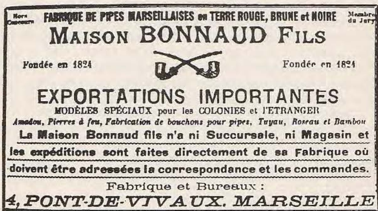
Afb. 6 Advertentie van de firma Bonnaud Fils